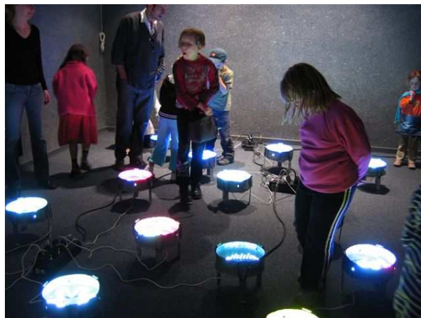
Pierre Petit, La rue , 1995 Collection Frac Alsace

A travers ce parcours, le public est invité à découvrir une sélection d'œuvres de la collection du Frac Alsace installées dans plusieurs espaces de la ville. Fruit d'une collaboration inédite avec des particuliers, ce circuit privilégie la discussion et l'échange autour des œuvres d'art. Conçu sous la forme d'une promenade, il permettra aux participants d'aller à la rencontre à la fois de l'art contemporain et du patrimoine Sélestadien.